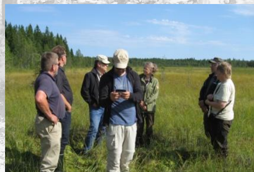
Asiantuntijat Kokkojärven- niityllä suunnittelemassa kosteikkoa