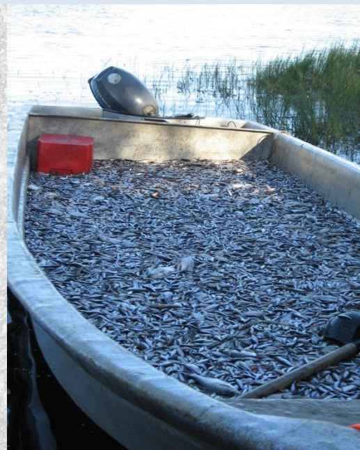
Jäälinjärvestä poistettiin särkiä melkein joka neliöltä

Luonnonympäristö on tänne ihmiset houkuttanut. Ihmisten vuoksi se on vuosien saatossa nuhrautunut. Ihmisten voimin panemme sen taas kuntoon.